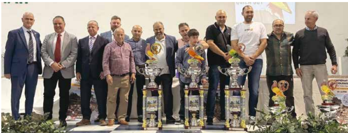
Campeonato Provincial de Castellón en La Llosa

Tanto los palomos concursantes, como las palomas han hecho que los árbitros para dichos