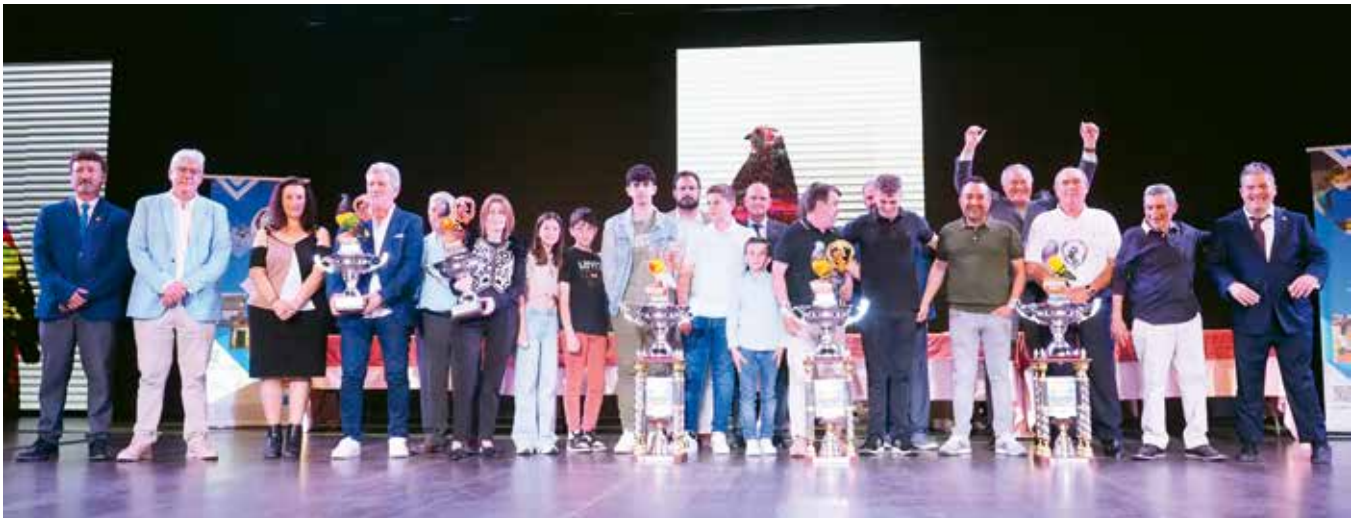
Campeonato Provincial de Alicante en Beniarbeig

campeonatos tuvieran que estar siempre al corriente de todo y estar al 100% arbitrando en cada detalle, por las situaciones que pasaban a lo largo de las sueltas para tenerlo todo controlado.