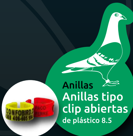
Anillas Anillas tipo clip abiertas de plástico 8.5