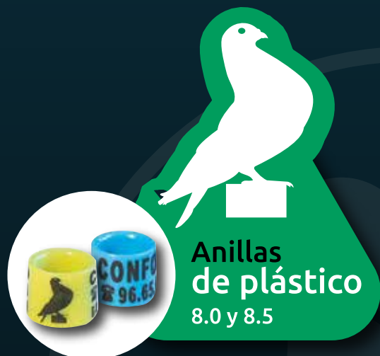
Anillas de plástico 8.0 y 8.5