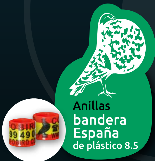
Anillas bandera España de plástico 8.5