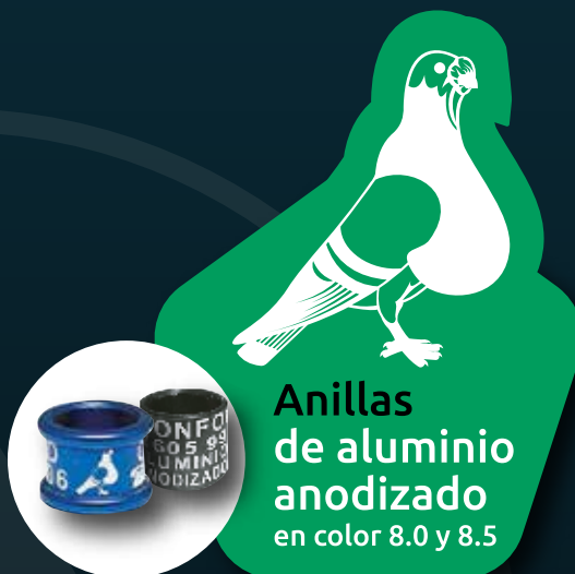
Anillas de aluminio anodizado en color 8.0 y 8.5