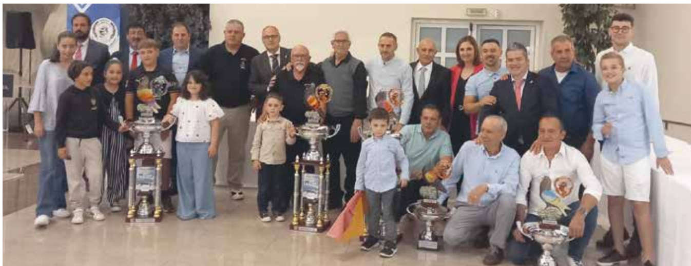
Campeonato Provincial de Valencia en La Llosa de Ranes

En la temporada 2025, en el ámbito de la Comunidad Valenciana es un año especial puesto que, con la eliminación de los campeonatos Regionales, vuelven a realizarse los Campeonatos Provinciales de Castellón, Valencia y Alicante.